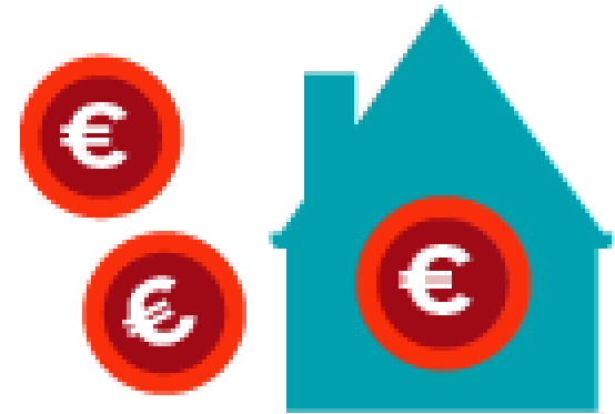
minder energieverbruik en huuraanpassing